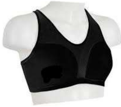
Protector de pecho tipo "TOP"